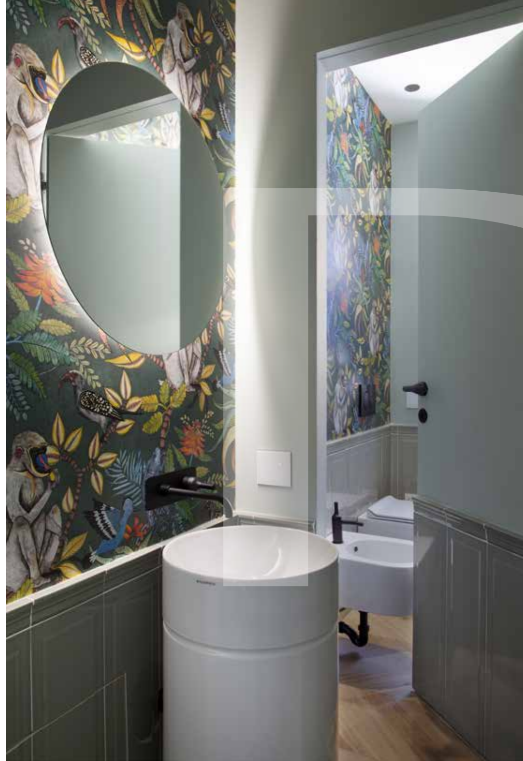
Bagno della zona giorno con ingresso separato dai servizi. Anche qui torna la boiserie, ma a mezza altezza, che abbinata alla carta da parati conferisce movimento e colore. Il lavabo freestanding e lo specchio rotondo retroilluminato donano al piccolo spazio un'atmosfera suggestiva.